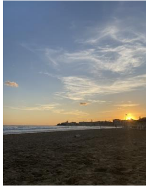
Strand in Sampieri