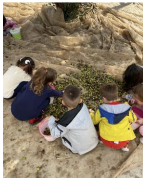
Ausflug: Öl machen