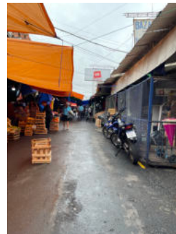
„Mercado 4“ in Asunción