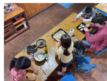
Empandas backen - super lecker:)

Im ideellen Sinne stellt es die Aufgabe dar, Kinder zwischen 4-8 Jahren nach dem Montessori-Prinzip „Aprendo jugando“ (Ich lerne spielend), selbstständig zu betreuen. Das bedeutet, anstatt frontalem Unterricht folgen zu müssen, lernen die Kinder über Spiele oder andere niedrigschwellig gehaltene Angebote, grundlegende Dinge wie z.B. Zahlen, Buchstaben, Logik, oder ganz simpel miteinander friedlich auszukommen. Sprachlich läuft alles auf Spanisch, das ich nun mit Freude lernen darf, wobei ich auch die schöne Erfahrung gemacht habe, dass Kinder recht universell funktionieren und man auch ohne viele Worte gut miteinander auskommt.