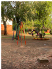
Der Außenbereich davor