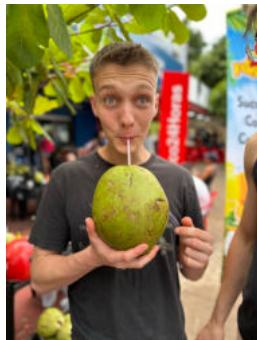
Kokosnuss in Brasilien