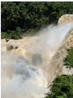
Der „kleine“ Wasserfall bei Ciudad del Este

Aber auch deutlicher näher bei uns - Asunción zum Beispiel ist mit dem Bus immerhin sieben Stunden entfernt - waren wir schon unterwegs. Im Radius einer Stunde, wäre da zum Beispiel die nächste große Stadt „Encarnación“ zu nennen, in der es einen besonders schöne Promenade gibt, an der sich fantastische Sonnenuntergänge genießen lassen. Oder Posadas, eine hübsche argentinische Stadt, auf der anderen Seite des gewaltigen „Rio Paraná“.