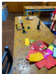
Bastelstunde: Tiere aus Klopapierrollen