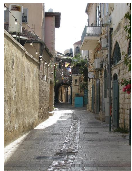
Eine der vielen Gassen in Nazrath