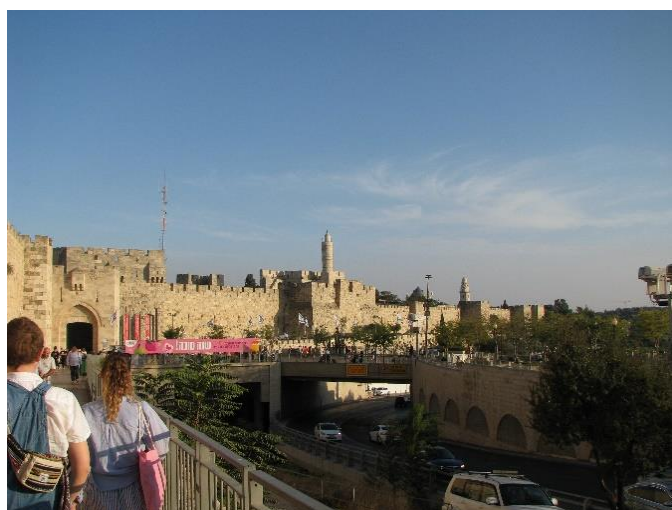
Auf dem Weg zum Zion Gate

Doch auch etwas anderes sah man in Jerusalem viel: Menschen mit Waffen. Seien es Polizisten und Soldaten in der Altstadt und ihrer Umgebung oder die Polizei, die bestimmte Plätze unter Beobachtung hielt. Es tut sehr weh, die Altstadt mit Überwachungskameras an jeder Ecke geschmückt und von Militär bevölkert zu sehen. Das fiel mir immer wieder in Israel auf und davor gab es auch gar kein Entweichen, diese Maßnahmen legten sich wie ein bitterer Schleier über all die schönen Dinge, die man dort erlebt. Erschreckend schnell gewöhnt man sich auch an sie, aber ein kleines Stück Entsetzen bleibt immer.