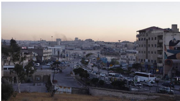
Die Straße vor unserer Unterkunft in Amman

Als wir im Bus von der deutschen Botschaft in Tel-Aviv über die Jordan-River-Grenze fuhren, war auch kein Platz mehr für Vermissten oder Trauer, zu viele Ereignisse in zu kurzer Zeit, als dass wir verstanden hätten, was hier vor sich ging. In Amman angekommen, hatte der fof glücklicherweise für uns eine Unterkunft finden können. Wir sollten in einer Schule untergebracht werden, in der auch deutsche Freiwillige arbeiteten. Wir waren sehr dankbar, wie uns die Schule versorgte und uns die Zimmer bereitstellte.