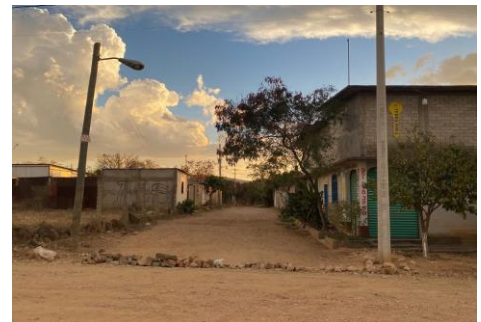
Reste kleine Strassenblockade