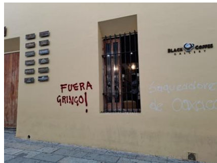
Studentendemo: Eingeschlagene Fenster