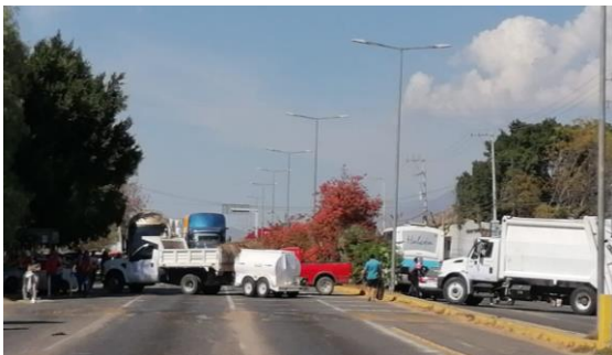
Strassenblockade auf der Hauptstrasse

Im habe ich den ersten etwas ernsteren Konflikt mitbekommen in unserer Gegend. Unser Nachbardorf, welches direkt gegenüber von unserem Haus beginnt, ist bekannt für so manche Auseinandersetzung in den letzten Jahren. Dieses Mal gab es einen Konflikt, in dem es um die Wiedereröffnung einer Müllhalde ging. Welche wieder geöffnet werden sollte (mittlerweile ist sie seit einigen Jahren geschlossen). Die lokalpolitische Situation dahinter war etwas kompliziert . Doch was wir konkret mitbekommen haben, waren Straßen, die blockiert wurden (kleine und große) und uns wurde dringend davon abgeraten, Abends/Nachts noch raus zu gehen. Es wurde auch die Polizei eingesetzt, die aber wohl die Situation nur zugespitzt hat. Seit den zwei Nächten ist die Situation wieder ruhig, doch Straßenblockaden gab es auch zu anderen Themen später noch. Mittlerweile habe ich gelernt trotzdem in die Stadt zu kommen auch wenn die Straßen blockiert sind. Die Blockaden sind hier in Mexiko oft eine Form des Protestes und die einzige Form, die wirklich wahrgenommen wird.