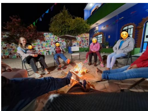
Lagerfeuer am 24 Dez.