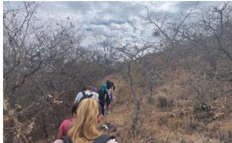
Wanderung mit Familie u. Kinderdorf