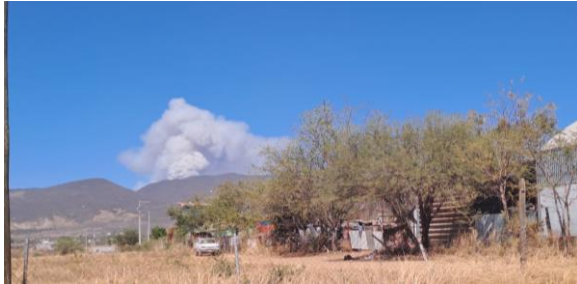
Rauchwolke Brand über San Bart.Coyot.

Und ja , Mexiko ist gefährlich, doch mit dem richtigen Verhalten und überlegtem Handeln kann man(in den meisten Teilen von Mexiko) problemlos sein Leben leben . Ein anderes Thema sind die Waldbrände , die im letzten Monat in unserer Umgebung passiert sind und nicht nur einige Häuser, sondern sogar Todesopfer gefordert haben. Die Brände entstehen durch die enorme Trockenheit. Denn auch außerhalb der Regenzeit sollte es regnen, was aber leider kaum passiert hier.