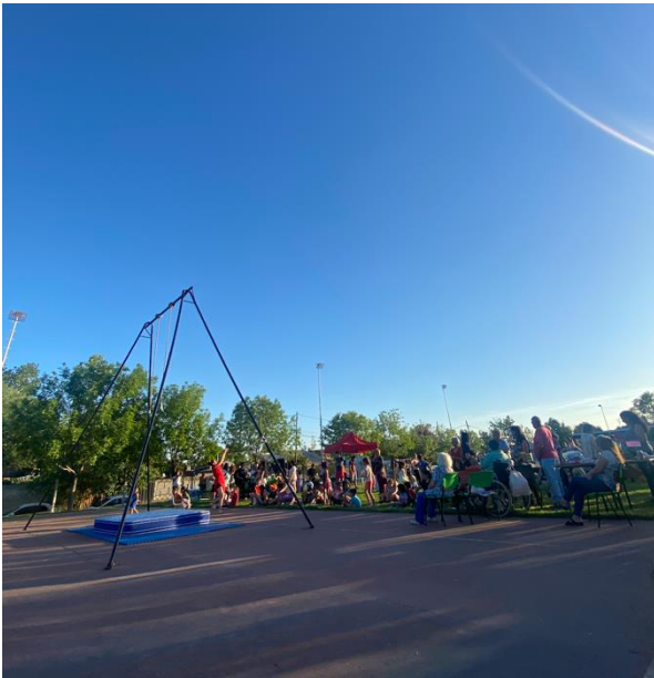
Beim „Festi-Cultural“ hat meine Kollegin ihre Zirkuskünste vorgeführt und uns damit alle verzaubert