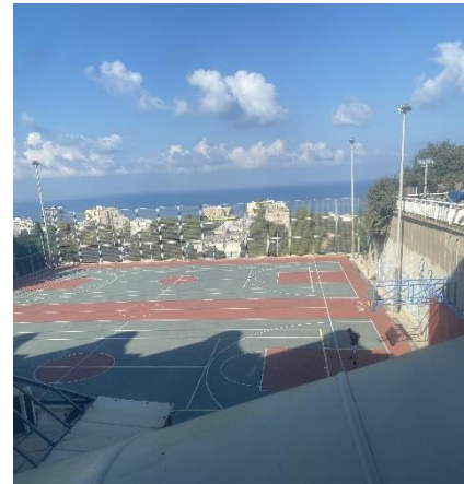
Aussicht über die Sportplätze des Leo Baeck Centers