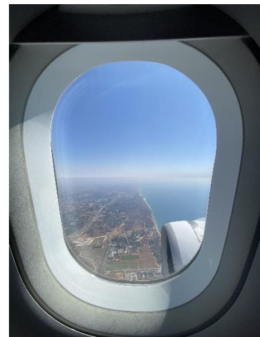
Erster Blick auf Israel

Mitte August war endlich der Tag gekommen, der eine große Veränderung in meinem Leben versprach. Die Koffer waren gepackt, das zwölfmonatige Visum in München abgeholt, die Familie am Flughafen verabschiedet und alle Zeiger standen auf Eigenständigkeit. Schließlich würde ich das erste Mal in meinem Leben nicht bei meinen Eltern wohnen und in einem entfernten Land, für dessen Kultur ich mich brennend interessiere, meine eigenen Erfahrungen sammeln. Auch war meine Vorfreude besonders groß, nach dem letzten der drei Vorbereitungsseminare im Juli die anderen Mitfreiwilligen wiederzusehen. Zu siebt sind wir somit von Frankfurt nach Tel Aviv geflogen und von dort ging es mit meinen beiden WG-Mitbewohnerinnen mit dem Zug weiter nach Haifa. Mit unserer Mentorin aus dem Leo-Baek-Zentrum durften wir die Stadt erkunden, uns wurden unsere Einsatzstelle, der sensationelle Ausblick über die ganze Stadt und den Norden Israels, die Bahai'i – Gärten gezeigt und erste Tipps für alltägliche Einkäufe gegeben. Ich war vom ersten Moment an fasziniert. Fasziniert von Haifa mit seiner diversen Bevölkerung, verliebt in die Sprache, in meine Arbeitsstelle und in die Freundlichkeit im Umgang in dieser.