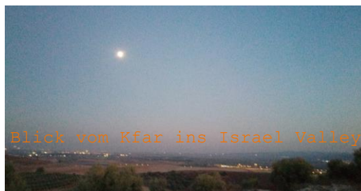
Blick vom Kfar ins Israel Valley

In diesem Alltag lebte ich die ersten fünf Wochen. Neben der Arbeit und viel Zeit in der Komuna lernte ich auch die Umgebung Stück für Stück kennen. Auf Spaziergängen in die Eisdielen oder ins Café mit Mitfreiwilligen oder auch, um den Komunaeinkauf zu erledigen. An den Wochenenden unternahmen wir zusammen Ausflüge, dank irgendwann erhaltener RavKav verlief dies dann auch recht unkompliziert, da die Busverbindung aus meiner Dorfperspektive ziemlich gut sind. Zum Beispiel öfter mal nach Haifa, um Föf-Mitfreiwillige zu besuchen.