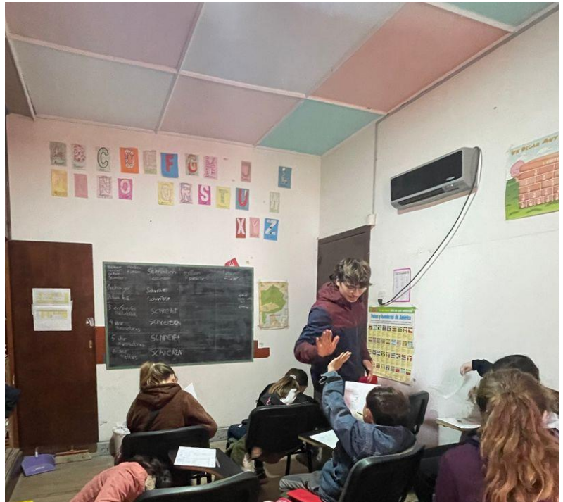
Logiksuche zu den Konjugationen im Deutschen

mir nie erträumen können, wie gut „Logik und Schach“ bei den Kindern ankommen würde. Jeden Mittwoch wurden die Bewegungen und Züge der Figuren gelernt und konzentriert Schachmattsetzen geübt. Am Anfang gefiel das noch nicht allen. Für manche war der Anfang etwas frustrierend oder mühsam. Irgendwann fanden die meisten Gefallen an dem Spiel und baten auch in den Pausen, die Schachbretter nutzen zu dürfen. Krönender Abschluss des Workshops war ein gemeinsames Turnier der Vormittags- und Nachmittagsgruppe. Voraussichtlich wird von diesem Workshop am meisten bleiben, denn die Schachregeln verschwinden, einmal verstanden, nicht so leicht aus den Köpfen. Aus dem Deutschworkshop werden einige Jugendliche Wörter und Ausdrücke mitnehmen, wobei noch viel Arbeit für die künftigen Freiwilligen übrigbleibt. Und vielleicht werden sich die Jüngsten in ein paar Monaten noch an Mobilisationsübungen und die Schritte zum Lied „Cotton Eye Joe“ erinnern, welche wir einstudiert haben.