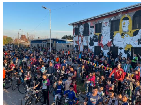
Bild 4: Der Versuch, alle Teilnehmer der Bicicleteada auf ein Fotos zusammenzufügen