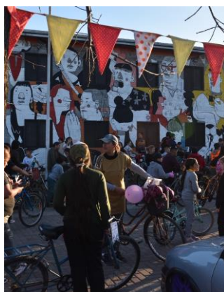
Bild 3: Ein schöner Moment der Bicicleteada mit der neu bemalten Wand im Hintergrund