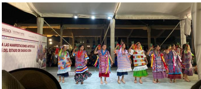
Baile flor de pina