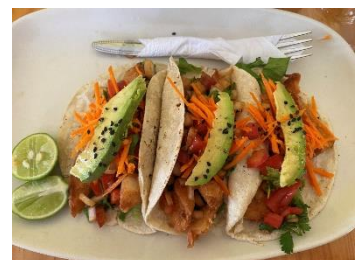
„Tacos de camarones“ am Strand

Von meinen Ballettstunden hatte ich mich als erstes verabschiedet. Mein Ballettunterricht hat mir nicht nur geholfen besser im Tanzen zu werden, sondern neue Leute kennenzulernen und zu verstehen, wie ich am sichersten nachts in der Stadt unterwegs bin und vor allem wieder sicher aufs Dorf komme. Ich war tatsächlich noch ein Wochenende am Strand und konnte mich von Puerto Escondido verabschieden, wo ich meine erste Reise in meinem freiwilligen Jahr hingemacht habe, wo ich Silvester gefeiert habe, wo ich noch