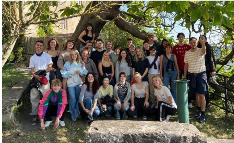
Der FÖF-Jahrgang 2023/24 auf dem Rückkehrseminar wiedervereint

bin mir sicher, dass die Erlebnisse des vergangenen Jahres mich haben toleranter, weltoffener werden lassen. Ich durfte Menschen aus aller Welt kennenlernen, darüber bin ich sehr froh. Gleichzeitig nagt das schlechte Gewissen an mir. Ich schnuppere für ein Jahr in eine andere Kultur, andere Welt, koste meine Einsatzstelle/ meine Organisation. Die letzten sechs Monate meines Freiwilligendienstes hat die Casa delle Culture keine „Ospiti“ beherbergt, somit frage ich mich, ob die Ressourcen, die in andere Freiwillige und mich gelaufen sind, nicht an anderer Stelle nützlicher gewesen wären.