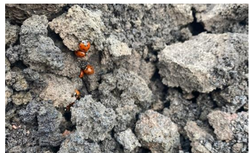
Auf dem Ätna: ein Haufen Geröll und mittendrin Marienkäfer auf 2500 Metern - wie erstaunlich die Natur doch ist!