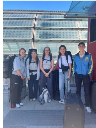
Ankommen in Turin