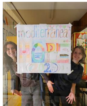
Kollage "mediterranean hope"