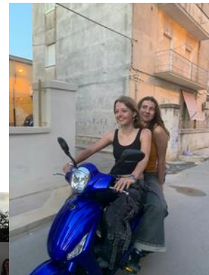
In Pachino Roller fahren

Aber auch die anderen Freiwilligen aus Pachino und Riesi haben wir bereits besucht. Das ist auch echt leichter als gedacht, da wir in Scicli momentan nur 2 Freiwillige sind, die für ein Jahr da sind und die Anderen aus dem Anfangsseminar kennen, weshalb wir sehr flexibel sind. Die Freiwilligen in Riesi sind zum Beispiel insgesamt acht Personen und sechs von ihnen haben uns hier auch besucht, wodurch wir eine kleine Herausforderung hatten, alle unterzubringen. Aber es war sehr schön sie wiederzusehen, weil die Freiwilligen eine ganz andere Arbeit machen und so auch ganz andere Erfahrung gesammelt haben und wir uns so viel zu berichten hatten. Es ist ein großer Unterschied, in was für einem Ort sie leben, da Riesi sehr dörflich und von Agrikultur geprägt ist und Scicli mit 26.000