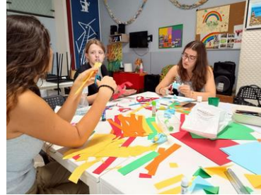
Vorbereitung des Schaufensters

Nachdem die geflüchteten Personen angekommen waren, änderte sich dementsprechend auch unsere vormittägliche Arbeit. Zwar gehört das Putzen des Aufenthaltsraums immer noch dazu, aber nach zehn Uhr ist Montags, Mittwochs und Freitags immer Sprachkurs für die Menschen, weshalb wir uns währenddessen um die Kinder gekümmert haben und ihnen ebenfalls die Zahlen und das Alphabet auf italienisch beibrachten. An den anderen Vormittagen ist Zeit für andere Aufgaben, wie zum Beispiel Aktivitäten für die geflüchteten Menschen zu planen und durchzuführen. Bei den Planungen wird uns viel freier Spielraum gelassen: wir haben bis jetzt zum Beispiel Musik mit ihnen gemacht, einen Vormittag zum Malen organisiert sowie auch einen Pizzaabend mit selbstgemachter Pizza. Aber auch simple Dinge, wie einen Ausflug zu einer Kirche in der Nähe oder ein Fußballspiel sind für alle sehr schön gewesen.