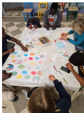
Malvormittag mit den Bewohnern

Starterpacks mit Handtüchern, Zahnputzzeug und weiteren Hygieneartikeln gehörte zu unseren Aufgaben. Außerdem machten wir nebenbei kleine Videos davon, um Posts für den Instagramaccount von “Casa delle Culture”, der Ausschnitte der Arbeit der Freiwilligen zeigt, zusammenzuschneiden (Name: volontarie_mhscicli).