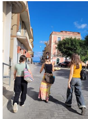
Freiwillige in Pachino besuchen

Nun sind auch schon mehr als zwei Monate vergangen und ich fühle mich sehr angekommen, nicht nur verstehe ich mich gut mit meiner Mitfreiwilligen und wir machen fast alles zusammen, aber wir haben auch schon mehrere Freunde in der Stadt gefunden, die wir in der Bar getroffen oder auch durch kreative Veranstaltungen, wie offene Jam Sessions, getroffen haben. So haben wir schon viele sehr sympatische und kreative Menschen kennengelernt. Außerdem sind die meisten Menschen auch super interessiert daran, was wir hier überhaupt machen und freuen sich uns neue Orte zu zeigen und neuen Menschen vorzustellen. Jedoch ist es schade, dass viele Menschen die wir kennengelernt haben jetzt zum studieren wieder in eine größere Stadt gegangen sind, jedoch kommen sie für die Feiertage wieder zurück und ich kann es kaum erwarten sie wiederzusehen.