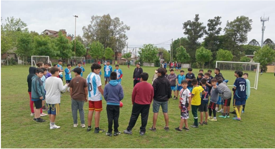
Die "Ronda" beim Fußballspieltag

Sozialprojekt, welches eine ganze Palette an verschiedenen Aktivitäten anbietet: Es gibt an drei Abenden in der Woche Fußballtraining für drei verschiedene Altersgruppen und am Wochenende sind dann regelmäßig Spieltage gegen Mannschaften aus anderen Projekten in der Umgebung. Dann gibt es noch eine Reihe