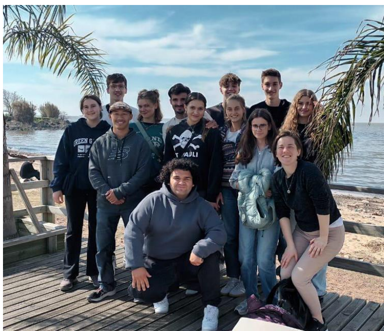
Gruppenbild meiner WG für die ersten zwei Wochen

Angekommen in Buenos Aires ging es für mich zu meiner vorübergehenden WG nach Olivos, einem schönen Viertel im Zentrum von Buenos Aires, das hier als „Capital“ bezeichnet wird. In dieser WG bin ich für die ersten zwei Wochen geblieben, denn wir hatten „Capacitación“ (übersetzt: Ausbildung; Lehrgang): ein zweiwöchiges Seminar mit allen Freiwilligen der Aufnahmeorganisation „Iglesia Evangélica del Río de la Plata“ (IERP). Diese Zeit diente dazu, uns auf das Jahr vorzubereiten, auf die Aufgaben, die kommen werden, auf das Land, sowie auch auf die Herausforderungen, die auf uns zukommen.