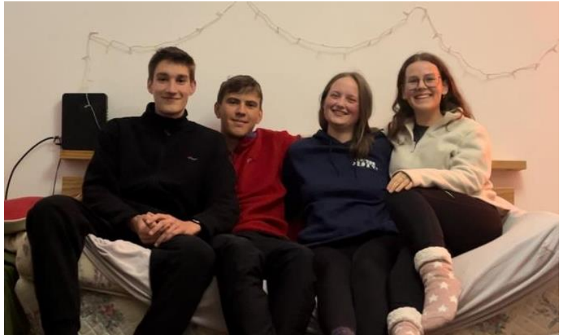
Meine WG in Brand Bourg