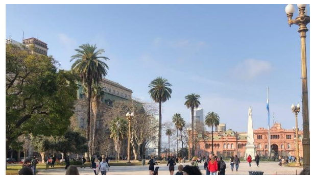
Der "Plaza de Mayo"

In den drei Monaten habe ich vieles erlebt, zahlreiche Menschen kennengelernt und mich auch schon ziemlich an das Leben hier gewöhnt. Schon bei der Arbeit ist mir aufgefallen, wie freundschaftlich und herzlich meine Mitarbeitenden zu mir sind, wie auch untereinander. Auch die Jungs vom Fußball sind mir sehr herzlich und zugewandt, insbesondere am Anfang, als ich noch sehr wenig Spanisch konnte. Insgesamt ist der Umgang innerhalb des Projekts sehr familiär, wobei diese