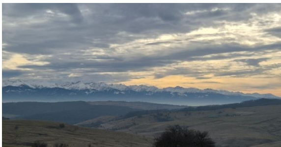
Strecke nach Seligstadt und Leblang

Da mir die Arbeit in Brasov sehr viel Spaß machte und mir schon einige Leute sehr an Herz gewachsen waren, konnte ich es mir nicht wirklich vorstellen, Brasov ganz hinter mir zu lassen. Daher haben wir uns nach Absprache mit der Gemeinde aus Brasov und der Gemeinde aus Fagaras darauf geeinigt, dass ich weiterhin zwei Tage die Woche in Brasov im Kindergarten und bei der Diakonie arbeiten kann, worüber ich sehr froh bin. Trotzdem musste ich mich von ein paar Leuten aus Brasov verabschieden, da der ganze Bereich der Jugendarbeit in Brasov für mich wegfällt und ich die Menschen, mit denen ich dort gearbeitet habe, nicht mehr sehen würde. Die Tatsache, dass alle Leute aus Brasov sehr verständnisvoll waren und nur das Beste für mich wollten, hat mir sehr geholfen und den Abschied und die Umstellung erleichtert. Außerdem war es sehr schön, dass der Wechsel nach Weihnachten ausgelegt war, sodass ich die Adventszeit noch in Brasov verbringen konnte und dann im neuen Jahr in Fagaras gestartet bin.