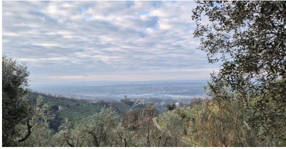
In der Toskana