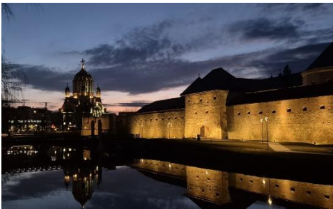
Burg und Kathedrale in Fagaras