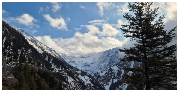
Wanderung am Transfagarasan