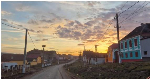
In Leblang nach dem Kinderprogramm

Wichtiger Bestandteil meiner neuen Arbeit sind die Kinder- und Jugendfreizeiten der Gemeinde. Die Freizeiten finden immer in Bekokten oder Seligstadt statt, in diesen beiden Dörfern, wurden die alten Pfarrhäuser, alten Schulen und sonstige Häuser der Gemeinde, die nicht mehr richtig genutzt werden, zu Jugendzentren mit vielen Übernachtung und Aktion Möglichkeiten umgestaltet. Die Dörfer liegen sehr schön gelegen in scheinbar unendlich weiten Hügellandschaften und ich fahre immer sehr gerne dorthin. Bisher war ich bei drei Freizeiten dabei und unsere Aufgabe ist hauptsächlich die Betreuung der Kinder/Jugendlichen sowie Planung und Durchführung von Spielen und Aktionen in Programm freien Zeiten.