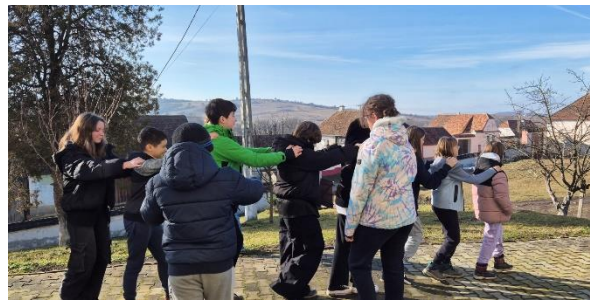
Kinderfreizeit in Seligstadt