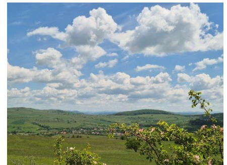
Bekokten in Landschaft