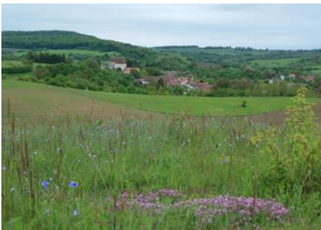
Seligstadt in Landschaft

Auch wenn die ganze Zeit klar war, dass man nur ein Jahr bleibt und der Abschied unumgänglich ist, fällt es mir sehr schwer sich zu verabschieden, besonders da man vor allem die Kinder wahrscheinlich nie wieder sieht.