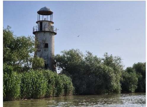
Am schwarzen Meer und im Donau Delta

Letzte Woche haben wir mit weiteren Mitarbeitern für eine große Kinderfreizeit, der sogenannten Kinderspielstadt, eine dreitägige Wanderung in den Karpaten unternommen. Die Landschaft und die Berge waren wirklich atemberaubend schön und wir haben die Tage wirklich sehr genossen, auch wenn die Übernachtung im undichten Zelt bei Gewitter, Plumpscko, kalte Außendusche und zum Frühstück Tee aus 500ml Bierkrügen eine ganz neue Erfahrung waren.