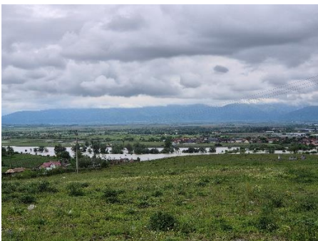
Landschaft mit Fluss Olt

Bei uns ist auch endlich der Sommer eingeekehrt. Nach zwei Wochen Dauerregen im Mai mit Überschwemmungen, bei denen wir Warnmeldungen auf unseren Handys erhalten haben und der Olt, der Fluss, der durch Fagaras fließt, über die Ufer trat, ist der Sommer nicht mehr wegzudenken. Es ist superwarm, an einigen Tagen fast schon zu heiß. Aber wir genießen es alle sehr. Das Frühjahr war hier wunderschön, im Mai war die ganze Landschaft unglaublich grün, überall wo man hingekuckte blühte und knospte es auf und die Sommerlandschaft ist bisher genauso schön. Überall blüht es und vor allem auf dem Land in den Hügellandschaften gibt es so schöne und viele Wildblumenwiesen, wie man sie sich in jedem Garten wünschen würde es, sie es aber in Deutschland fast gar nicht gibt. Ich muss sagen, die Unberührtheit der Landschaft hat mich hier wirklich beeindruckt und ich habe sie ins Herz geschlossen. Es gibt zwar auch Landwirtschaft, aber in den Hügeln, Wäldern und Bergen ist der menschliche Einfluss viel geringer und die Natur dadurch viel unberührter und schöner! Man sieht hier auch viel regelmäßiger Tiere in der Landschaft, als in Deutschland. Unzählige Schafsherden, Rehe, Füchse, Raubvögel, Fasane und vieles mehr laufen einem hier über den Weg.