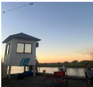
Am Fluss mit Blick auf die Insel

allem bei Regen in eine schlammige Angelegenheit verwandeln kann. Im Zentrum gibt es zwei Hauptstraßen mit vielen Läden, sodass man eigentlich alles findet, was man braucht. Da wir durch