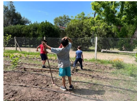
Kinder aus dem Projekt bei der Gartenarbeit