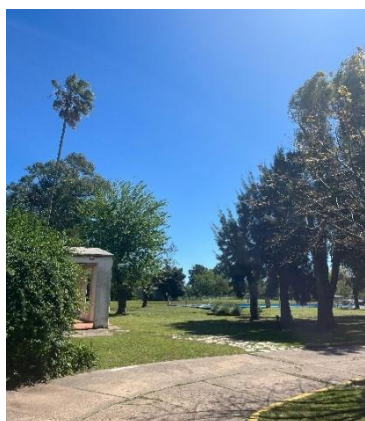
Unser Grundstück Hogar German Frers