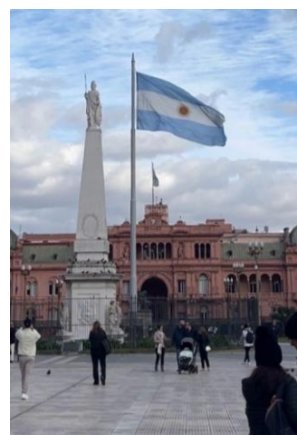
Der Plaza de Mayo in Buenos Aires