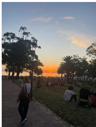
Sonnenuntergang im Parque

Die ersten Tage verbringen wir damit, hässliche Tischdecken zu verstecken, Bilder und Wimpelketten aufzuhängen und mit dem Versuch, dem Haus unseren persönlichen Touch zu verpassen. Mittlerweile zeugen Pflanzen, eine Uruguay Flagge und geschenkte Bilder aus den Projekten von unserem Da-Sein.