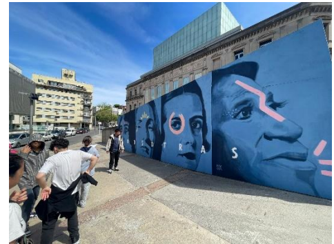
„Paseo de murales“ in der Altstadt

Problematisch wird es immer dann, wenn Konflikte zu verbaler und physischer Gewalt führen, was vor allem