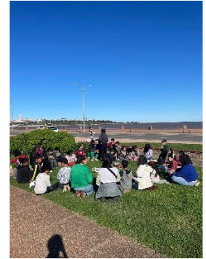
Merienda mit dem Kinderclub am Rambla

Ein wichtiger Bestandteil des Kinderclubs ist auch die direkte Zusammenarbeit mit den Familien der Kinder. Viele der niños sind in Umgebungen aufgewachsen (andere leben immer noch unter diesen Bedingungen), die von Drogen und Gewalt geprägt sind. Die finanzielle und mentale Unterstützung der Familien und der enge Austausch mit Bezugspersonen nimmt neben dem normalen Club-Alltag also viel Raum ein, wobei ich hier aufgrund der Sprachbarriere, der kurzen Zeit meines Aufenthalts und vor allem der fehlenden Ausbildung nicht eingeplant bin. Immer wieder denke ich darüber nach, inwiefern es hilfreich wäre, die Familien- und Lebenssituationen der Kinder und Jugendlichen konkreter zu kennen. Ich glaube, ich könnte viele Prozesse und Ansätze in der Obra besser einordnen und verstehen. Andererseits weiß ich nicht, wie sich die Leichtigkeit in unserem Kontakt dadurch verändern würde, ob mir situativ das Lachen und die Unbeschwertheit verloren gehen würden. Weil das ja auch gerade das ist, was ich ohne Ausbildung aber mit Einsatz und Offenheit bieten kann.