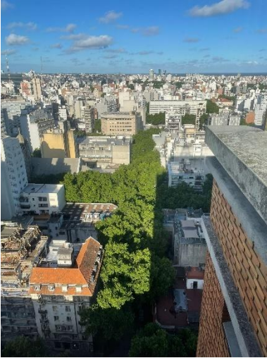
Montevideo von oben

Ich schwimme durch ein Meer, ein weites, saftig-grünes Bäumemeer, dass sich seinen Weg durch die hohen Betonbauten der Stadt bahnt. Der Frühling ist gekommen, und ich kann jeden Tag sehen wie sich die zu Beginn noch so kalte Großstadt, langsam, aber sicher in das von mir so ersehnte warme Montevideo verwandelt.