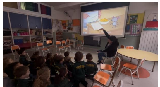
Deutschunterricht im Kindergarten

Da das Sembrador nur vier Tage in der Woche geöffnet hat gibt es seit diesem Jahr eine zusätzliche Einsatzstelle. Die Holmbergschule ist eine Privatschule im Zentrum von Quilmes, an der deutsch als erste Fremdsprache unterrichtet wird. Anders als in Deutschland können Kinder und Jugendliche hier vom Kindergarten bis zum Schulabschluss die gleiche Schule besuchen. Im Kindergarten bekommen die Kinder ab drei Jahren zweimal die Woche Deutschstunden von ca. 30 Minuten. Montagvormittag begleite ich Deutschlehrkräfte durch die unterschiedlichen Gruppen. Um den Kindern die deutsche Sprache näher zu bringen, spielen wir Bingo mit Farben, basteln Laternen für den Sankt Martins Umzug oder lesen Bücher wie zum Beispiel „Die kleine Raupe Nimmersatt“. Ich bin immer wieder überrascht wie viel die Kinder sich schon merken können und es bereitet ihnen Spaß, Lehrkraft für mich zu spielen und mir ganz viele spanische Wörter zu erklären.