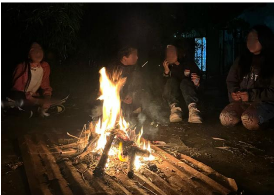
Campamento im Sembrador

Die ersten Wochen im Sembrador waren gar nicht so leicht für mich. Auf der einen Seite war (und ist) da die Sprachbarriere, die, trotz vier Jahren Spanisch in der Schule, größer war als gedacht. Auf der anderen Seite kostete es mich mehr Kraft und Zeit als erwartet, mich im Projekt einzufinden. Mittlerweile lebt das Sembrador für mich durch die offene Strukturen und der Spontanität der Mitarbeitenden, am Anfang sehnte ich mich aber mehr nach klarer Koordination und Aufgaben, wie ich es aus der Schule gewohnt war. Die ersten Wochen und Monate fühlte ich mich oft überflüssig und alleine und obwohl ich wusste, dass die erste Zeit vom Beobachten geprägt sein wird, schlaucht mich das oft noch ganz schön. Dazu kommt, dass ich zu Beginn Probleme hatte, eine Bindung zu den Kindern und Jugendlichen aufzubauen. Kippunkt war für mich ein Camp, das im Oktober im Projekt stattfand. Jugendliche aus der mittleren Gruppe verbrachten eine Nacht im Sembra; wir spielten Völkerball, formten Modelliermasse, lösten eine Art Schnitzeljagd im Dunkeln und saßen abends gemeinsam am Lagerfeuer. Zwischen all dem Programm überwindete ich mich spontan ein Spiel anzuleiten und trotz der Sprachbarriere funktionierte es richtig gut. Bis heute spielen wir das Spiel regelmäßig. Das