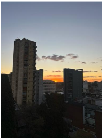
Ausblick von unserem Balkon

Ende August stand dann der Umzug in unsere endgültigen Wohnungen an. Auf der einen Seite war da der Abschied von anderen Freiwilligen, die ich, während dem Seminar kennengelernt habe, auf der anderen Seite die Vorfreude, dass es jetzt wirklich losgeht. Ich wohne in Quilmes, einer Stadt im Großraum Buenos Aires. Quilmes liegt etwa 17 km vom Stadtzentrum Buenos Aires entfernt. Meine Wohnung teile ich mir mit zwei anderen Freiwilligen. Da wir die ersten Freiwilligen in dieser Wohnung sind, war es hier zu Beginn noch ganz schön leer. Mittlerweile haben wir uns aber ein bisschen eingerichtet und mir schweben noch ganz viele Projekte im Kopf, wie wir unsere kleine Wohnung gemütlicher gestalten können. Das Highlight unserer Wohnung sind für mich die Dachterrasse und der Balkon, von wo aus wir die schönsten Sonnenuntergänge beobachten können.