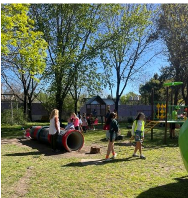
Besuch in einem öffentlichem Kindergarten mit dem Proyecto solidario

Ein anderer Aufgabenbereich an der Holmbergschule ist für mich das Fach CAS. CAS steht für Creatividad, Accion, Social und wird ab der sechsten Klasse verpflichtend unterrichtet. Das Ziel des Faches ist es, dass Schüler*innen ihre eigenen Fähigkeiten kennenlernen, Probleme in der Gesellschaft erkennen und dem entgegen soziale Projekte zu organisieren. Diese Projekte gehen von Projekten intern an der Schule (wie beispielsweise ein stufenübergreifendes Frühstück mit Essen aus der ganzen Welt), über eine Adoptionskampagne mit dem lokalen Tierheim bis hin zu einer Baumpflanzaktion am Rio. Im Vordergrund stehen das Entwickeln, Durchführen und Reflektieren der Projekte und ich finde es bemerkenswert, dass dieses Fach verpflichtend unterrichtet wird. Ich unterstütze die Lehrkraft des Faches bei administrativen Tätigkeiten, so erstelle ich beispielsweise Präsentationen über den Unterricht oder Listen mit Filmvorschlägen für ein Kinoprojekt das bald durchgeführt werden soll. Eine ganz andere Arbeit, die mir aber neben dem ganzen Menschenkontakt eine willkommene Abwechslung bietet.