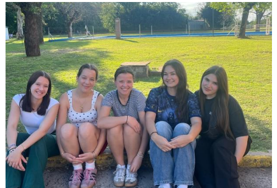
Campamento mit anderen Freiwilligen in Baradero

Die Wochenenden verbringe ich mit anderen Freiwilligen. Oft fahren wir nach Capital, die Innenstadt. Wir versuchen uns die riesige Stadt Stück für Stück zu erschließen und es gibt noch so viele Viertel, Parks und Museen, die ich besuchen will. Im Oktober hatte ich die Möglichkeit, eine befreundete Freiwillige in Baradero, eine Kleinstadt etwa drei Stunden außerhalb von Buenos Aires, zu besuchen. Ich konnte ein bisschen argentinische Landluft schnuppern: Pferde, die am Straßenrand grasen und mir auf der Straße frei entgegenaloppiert sind, weite Felder und eine ruhige und gemütliche Innenstadt mit kleinen Cafés und Läden. Das hat mir nochmal einen anderen Blick, außerhalb von der Metropole Buenos Aires, auf das Land vermittelt und ich freue mich schon darauf noch mehr zu sehen.