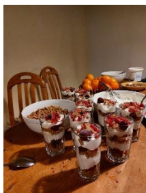
unser Nachtisch ;)

Zwischen dem letzten Bericht und diesem liegt nicht nur die Wochen hier in Braşov, sondern auch meine zwei Reisen. Auch jetzt im Nachhinein fühlt sich das immer noch so surreal an. Als ich noch in Deutschland war, hätte ich nie gedacht, dass ich so schnell mal so viel von der Welt sehe.