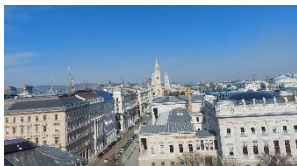
Blick vom Justizpalast