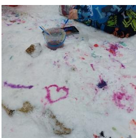
Kinder malen im Schnee

Kindergarten gehört nach wie vor zu meiner Haupt Arbeit! Und weil ich jetzt nicht nochmal dasselbe wie im letzten Bericht schreiben möchte, lass ich die ganzen Abläufe diesmal weg, daran hat sich eigentlich nichts geändert. Man könnte fast sagen, die Tage laufen immer relativ ähnlich ab. Und das mag jetzt für den einen oder anderen etwas langweilig klingen, aber das ist es nicht - ganz im Gegenteil! Auch wenn die Abläufe und Routinen immer die gleichen sind, kein Tag sieht aus wie der andere. Im Kindergarten arbeitet man ja bekanntlich mit Kindern und die sind nie vorhersehbar. Ich hatte gedacht so langsam kenne ich die Kinder so gut und die Kinder mich, dass sich bestimmte Verhältnisse eingependelt haben. Damit meine ich, dass manche Kinder einen näher an sich ranlassen und andere eben weniger. Bei mir war das gerade bei den Kleineren, mit denen ich eher weniger zu tun hatte, weil es da auch teilweise mit der Sprache ein bisschen schwer ist. Und dann wurde ich am Freitag aber wieder überrascht. Es war schönes Wetter und nachdem wir von einem Jungen den 6. Geburtstag gefeiert haben, sind wir mit den Kindern auf den Spielplatz gegangen. Und