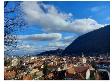
Blick vom weißen Turm

Ich glaube ich habe ein kleines Problem... Seit dem letzten Bericht ist so viel Zeit vergangen, in der so viel passiert ist, dass ich gar nicht weiß wo ich anfangen soll. Das ist auch kein Wunder, denn mittlerweile bin ich ja schon seit mehr als einem halben Jahr in Braşov, was sich ziemlich surreal anfühlt. Zwischen dem letzten Bericht und diesem liegt ein ganzer Winter... Ein Winter der dann doch nochmal sehr viel kälter und mit sehr viel mehr Schnee verbunden war, als ich es von zu Hause aus Karlsruhe kenne. Wir hatten teilweise minus 15 Grad tagsüber... Und so schön schneebedeckte Berge auch aussehen können, ich bin ehrlich, ich bin sehr froh, dass es jetzt in Richtung Frühling geht! Apropos Frühling... Ich sitze gerade an meinem Lieblingsort in Braşov, den ich für mich entdeckt habe. Das ist der weiße Turm. Von meiner Wohnung nur 20 bis 30 Minuten zu Fuß entfernt. Man hat von hier einen wunderschönen Blick über die Stadt und auf der gegenüberliegenden Seite auf die Zinne, den Berg mit der "BRAŞOV-Schrift". Der ist momentan noch kahl, aber so langsam sieht man die ersten kleinen grünen Knospen an den Bäumen. Ich freue mich so sehr darauf, wenn alles grün wird und anfängt zu blühen! Trotz Heuschnupfen!!! Hier oben verbringe ich auch oft, wenn das Wetter schön ist, meine Mittagspausen. Dann gehe ich direkt vom Kindergarten hierher und höre Musik, lese etwas oder telefoniere.