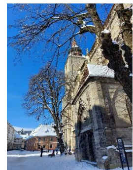
die schwarze Kirche