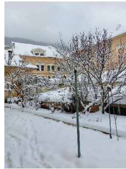
Unser Garten im Schnee