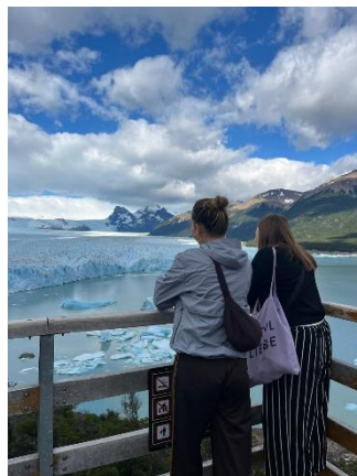
Glaciar Perito moreno