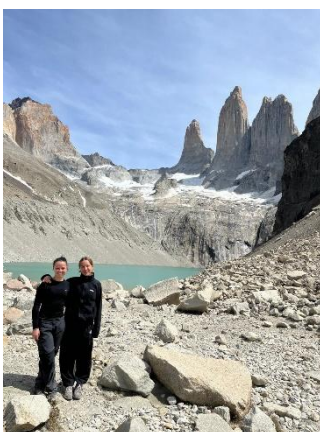
Laguna de los tres

Es scheint absurd nach vier Stunden Flug immer noch im gleichen Land zu sein und nach sechs Monaten Buenos Aires plötzlich durch endlose Landschaft zu fahren. Unsere Reise führt uns für ein paar Tage nach Chile, wo wir an Alpakas vorbei Richtung erste große Wanderung fahren. Vorbereitet mit geschmierten Broten wie bei Mama, wandern wir auf die Laguna de los tres. Und nur ein paar Tage später stehen wir vor dem berühmten Patagonia logo auf dem Fitz Roy.