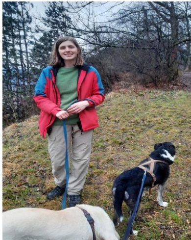
Ausflug mit den Hunden Cara und Oreo in den Wald

bisschen vorsichtiger geworden, aber ich mache immer noch gerne Ausflüge mit den Hunden. In die wirklich wunderschönen Berge.