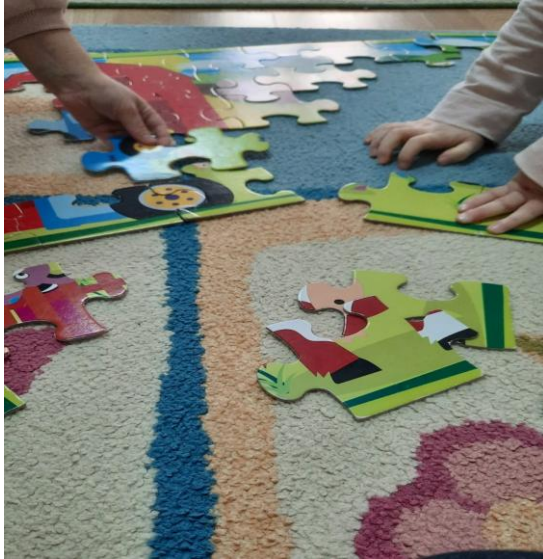
Puzzeln mit den Kindern im Kindergarten

machen, weil der Leiter des Altenheims ziemlich plötzlich verstorben ist und ich deswegen keinen wirklichen Ansprechpartner hatte, sondern einfach von Zimmer zu Zimmer gelaufen bin und die Menschen kennengelernt habe.