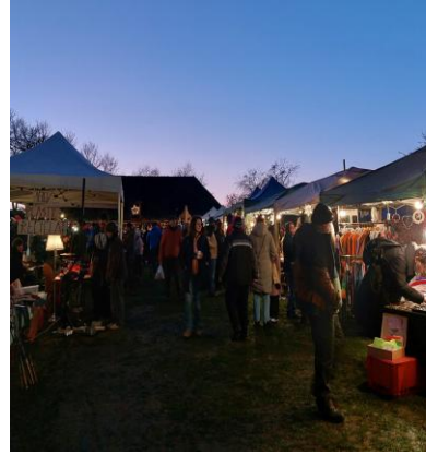
Weihnachtsmarkt in Holzungen