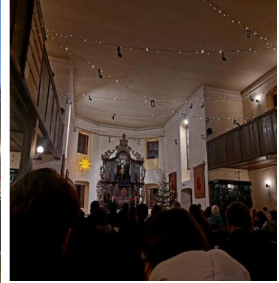
Jugendgottesdienst in der Adventszeit